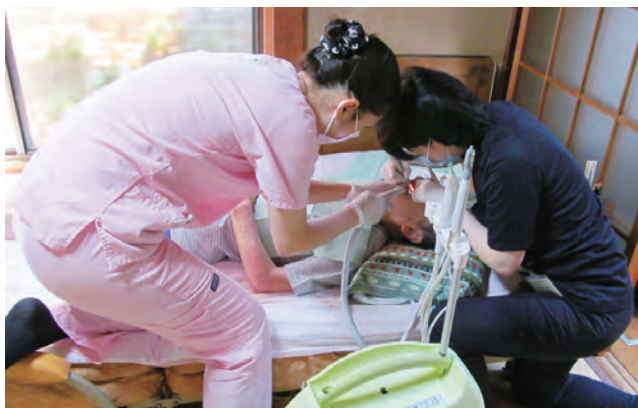
訪問診療による歯の治療

特に認知症や脳血管疾患などで要介護状態になると、歯がそろっていても、入れ歯が合っても口やのどの動きが悪くなっていることが多いため食事ができません。栄養を摂れないと体重が減る、筋肉も減る、基礎代謝も落ちるといふ負のスパイラルに陥ります。その結果、誤嚥性肺炎になるリスクも高くなります。