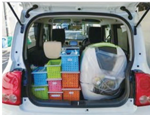
訪問診療に必要な器具機材