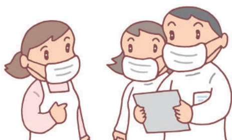
患者・家族はチームで支える

(1)については「薬剤師をチームに加えて麻薬管理する」「必要に応じて生活保護を受けられるか検討する」「ADL(日常生活動作)が落ちる前にリハビリを始める」などの意見が出されました。(2)では「(患者と信頼関係ができてい)看護師が本人から本音や価値観などを聞き出せるとよい」「本人が終末期をどのように過ごしたいかを考えてもらうきっかけづくりが必要」「本人が相談しなくなったら応えられるような環境づくりをする」などが提案されました。いずれも本人と専門職との信頼関係の構築がキーワードとなりました。