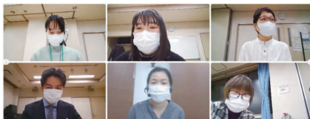
井草圏域の地域ケア会議（Webex）

井草圏域では、さらに「PCR検査の結果が出るまでの訪問支援の不安」「訪問時の感染防止対策」など、具体的なテーマについて意見交換をしました。「利用者が38度以上の発熱後、陽性と診断されるまでに1週間ほどかかり、その間の対応が難しかった。こうしたケースについて社内で独自の規則を作ることになった」（訪問介護）。同様に「訪問診療後に患者のコロナ感染を、家族からではなくケアマネからの連絡で知った。その間に訪問診療した患者のことが心配になった」（歯科医）などの報告がありました。