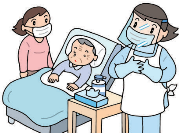
防護服で訪問介護

阿佐谷圏域では、患者・利用者とその家族が感染を恐れて訪問診療・介護、通院を避ける事例が増えたことが報告されました。その結果、「患者・利用者の病状などの情報が少なく、気が付いた時には悪化していた」（ケアマネジャー、以下「ケアマネ」）などの指摘が相次ぎました。また、「退院時カンファレンスが開催できなくなり、患者の状態が多職種間で十分に共有できない状況があった」（ケアマネ）という報告も。薬剤師や民生委員からは、訪問しようとしても先方から「遠慮してほしい」「玄関先に置いて帰って」と言われ、話す機会がほとんどなくなったとの声も上がりました。