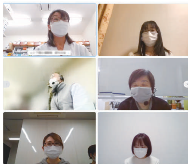
方南・和泉圏域の地域ケア会議 (Webex)

こうしたリスクを回避するための対策としては、「トラブルや危険が予想される場合は、一人で訪問しないようにする。例えば、他職種の人と時間を合わせて訪問するのはどうか」「看護師かアシスタントと一緒にに行くようにしている」などが挙がりました。さらに、訪問介護などのサービスでは「利用者と事業者間の契約の中に、ハラスメントなどの言動があった場合はサービスを停止することを明記できないか」との提案もありました。