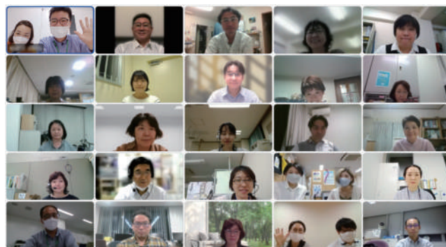
〈会議終了時の記念撮影〉

【方南・和泉圏域】 対面とオンラインを1回ずつの計2回(10月と1~3月)開催を目指す。テーマは多職種連携の困りごと。