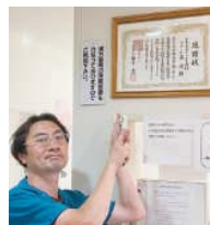
↑コロナの診療について区長から表彰されました。

に何が隠れているかを探る作業は神経を使います。コロナ禍では、呼吸器が専門の私がコロナ患者を診ないという選択肢はなく、一般診療と時間帯を分けて発熱外来を続けています。