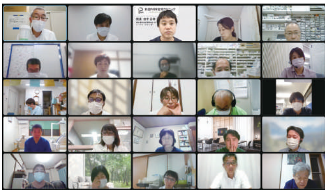
同職種・多職種による連携の必要性を再認識したオンライン会議

今年度の開催トップとなった西荻圏域(9/16、オンライン開催)は、「在宅医療と介護のBCP(Business Continuity Plan=事業継続計画)を考える～自然災害を中心に～」をテーマに話し合いました。背景として、地震や感染症などの自然災害でサービス提供への支障が懸念されている介護事業者は、2024年までにBCPを策定することが義務付けられたことがあります。被災しても被害を最小限に抑え、業務を継続したり、早期に復旧したりすることが狙いです。