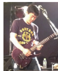
ライブ演奏に熱が入ります