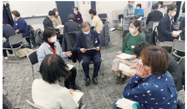
車座で話し合う西荻圏域のグループワーク

ない退院時カンファレンスがコロナ禍で開催されなかったことや、必要な職種が参加できず、十分な情報共有が行われていないことでした。例えば、「救急搬送された患者が退院したら、主治医ではない医師が担当になっていたり、ケアマネジャーに連絡が行ってなかったりするケースがある。患者と信頼関係があるところへ帰してほしい」という声が聞かれました。また、「退院が決まってから在宅療養の対応を考えるのではなく、入院中に準備しておく必要がある」という意見も出ていました。こうした課題を解決するためにも、適宜バイタルリンク(杉介ネット)などのICTを活用して、情報共有することが必要だとする指摘がありました。