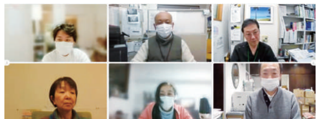
オンラインでのグループワークの様子

阿佐谷圏域の地域ケア会議は3月2日、「薬剤師との連携を深めよう」をテーマに、オンラインで開催しました。約50人の参加者のうち、約20人が薬剤師であり、阿佐谷圏域の薬剤師が多職種連携に大きな関心を寄せていることが伺えました。グループワークでは各グループに3人の薬剤師が入り、在宅医療における患者の服薬で困っていること、分からないことなどについて意見を出し合いました。