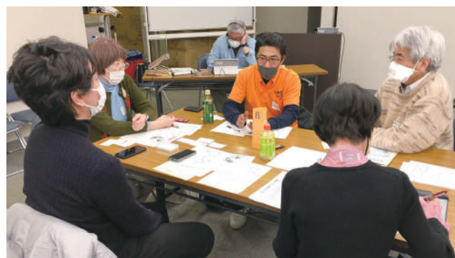
荻窪圏域は対面とオンラインのハイブリッド開催

など利用者について気付くことがあったら薬局からかかりつけ医へ連絡してほしい」、「ケアマネジャーは月に1回しか本人に会わないので、本人の日常を知る人たちから日頃の様子を聞ける仕組みがあるとよい」などの意見がありました。「早期発見」については、「見守りが必要な独居高齢者の近隣住民、スーパーのレジ係、美容院、民生委員などに、異変に気付いたら知らせるべき窓口を周知しておく」と、「認知症サポーター養成研修を一層広めた方がよい」、「若い世代にも地域包括支援センターをもっと広報した方がよい」といった声がありました。また、歯科医師からは、「外来で高齢者を治療しているが、これからは患者のより多くの背景情報を仕入れて、見守る意識を持って診ていきたい」とのコメントがありました。