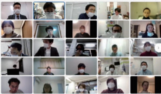
グループワークの発表の様子

一方で、入院・在宅に関わらず、息子の依存症治療が重要という意見が多くありましたが、問題はそこに至る過程です。入れ代わり立ち代わり訪問すると、息子がパニックを起こす恐れがあるため、多職種で連携しながら一つずつ慎重にサービスを入れていった方がいいとの指摘がありました。また、訪問は二人以上で行わないと危ないと懸念する声も出ました。息子とどうやって信頼関係を築くかが最初の関門になりそうです。そのほか、後見人制度、金銭管理代行サービスなどの利用を勧めるアドバイスも出ていました。