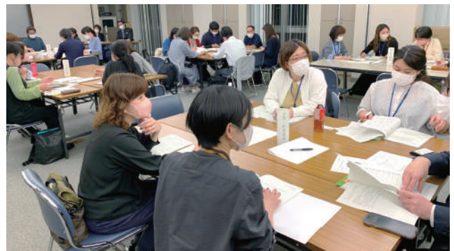
全体会のグループワークで今年度の方針を議論